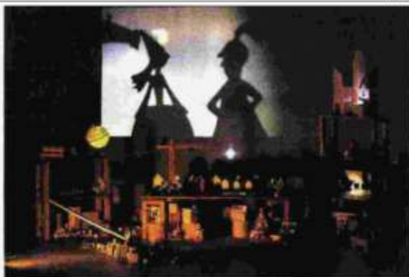
«Tenace soldatino di piombo»