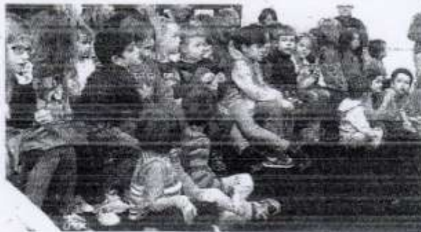
Bambini in prima fila per assistere allo spettacolo